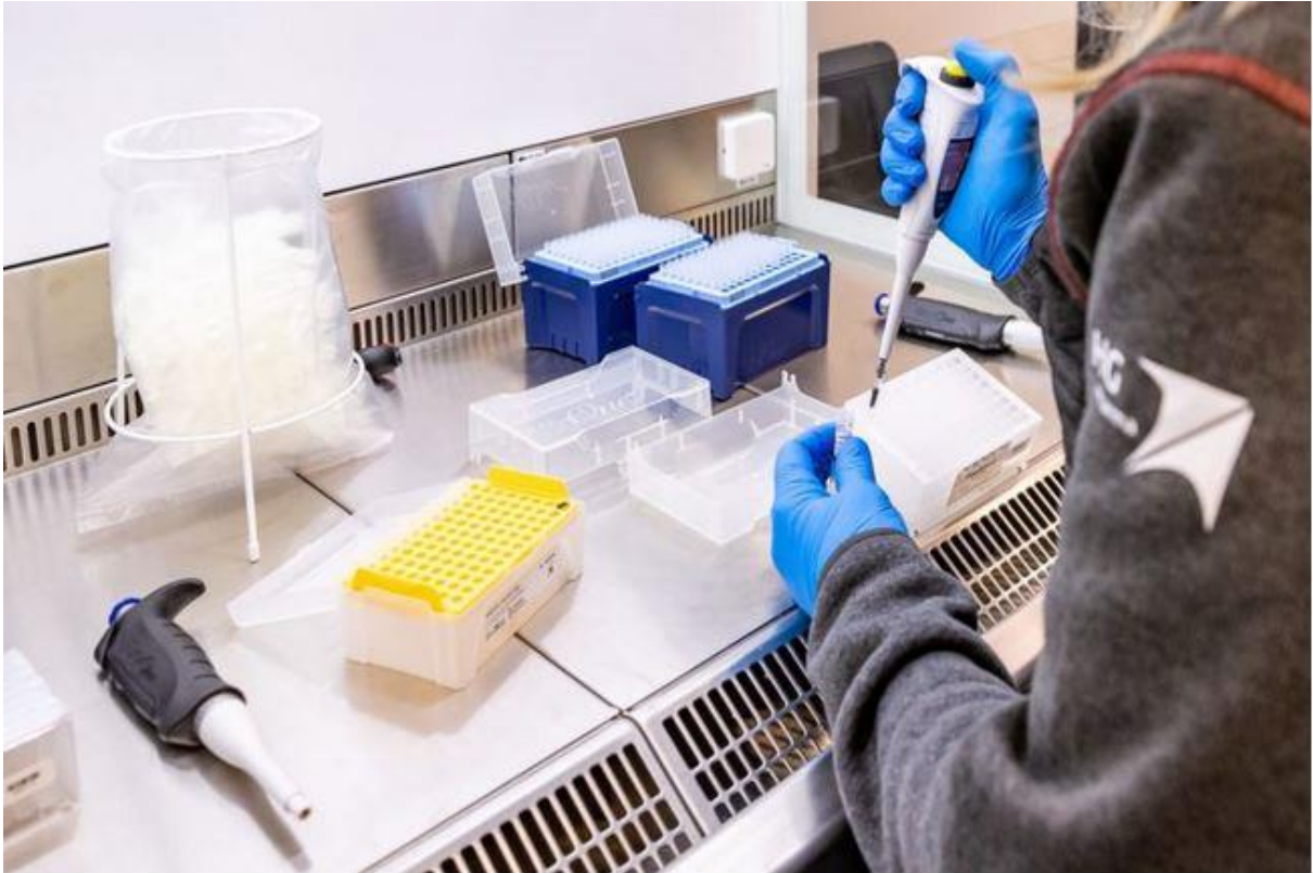
+++ PCR-Test springt auch auf frühere und unbemerkte Infektionen an: Ist die »zweite Welle« ein Riesen-Irrtum? +++